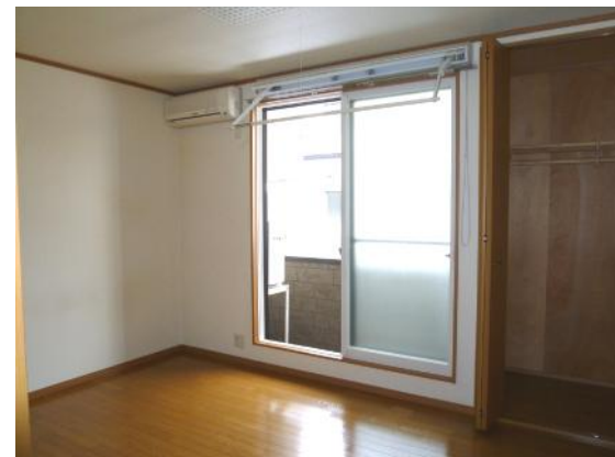
●洋室…室内物干し付き 収納あり ベランダ付き