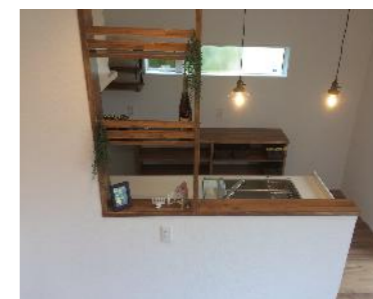
♪ リビングが見渡せるオープンキッチン