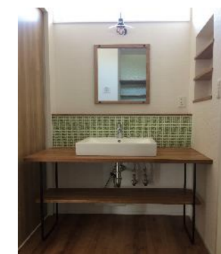
♪ オリジナルの洗面所