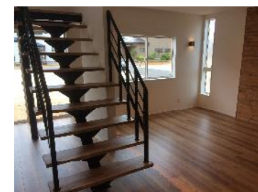
♪ 開放感のあるセンター吹抜け階段