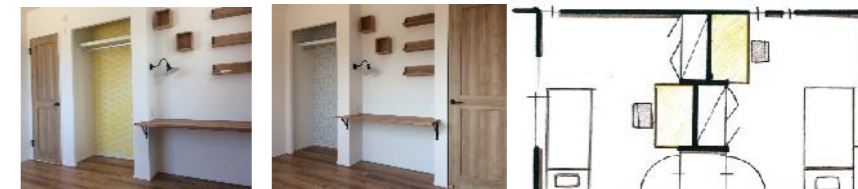
?造付け机のある子供部屋

ご家族のコミュニケーションを育むスキップフロアのL.I.いつもご家族を感じられる空間がおすすめです。